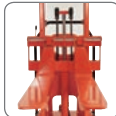
Justerbare gaffler i mange forskjellige lengder og typer.