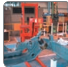
Fås med sidevippegaffler og/eller ekstra utstyr som f.eks. fatvender, innbygget lader, fjernbetjening og posisjoneringsutstyr.