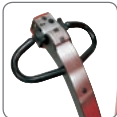
Mulighet for å kjøres med håndtaket i loddrett stilling. Sentral plassering av betjeningsfunksjoner.

Sterk konstruksjon sikrer lang levetid og lave vedlikeholdskostnader.