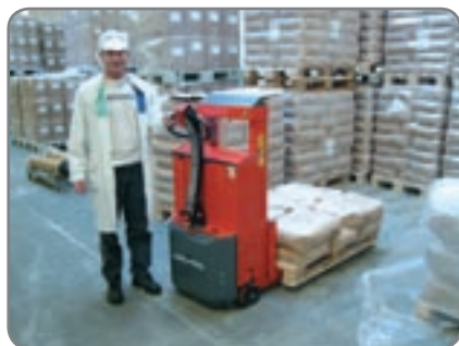
Optimal sikkerhet bl.a. med gjennomsliktig, slagfast beskyttelsesplate i mast og redusert kjørehastighet i løftet posisjon.