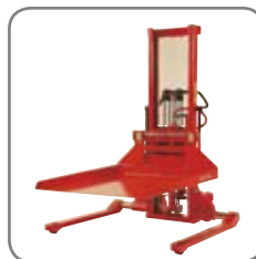
Av annet ekstra utstyr tilbys bl.a. plattform og kranarm.