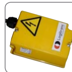
Mottaker til trådløs fjernbetjening. Monteres på vognen.

Vi tilbyr også kundetilpassede løsninger.