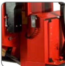
Kabelfjernbetjeningen plasseres enkelt og greit på vognen.