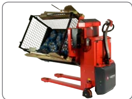
På Rotator styres rotasjonen som standard med kabel fjernbetjening. Trådløs fjernbetjening leveres som ekstra utstyr.

Fjernstyring må kun foregå med fullt utsyn over arbeidsoperasjonen!