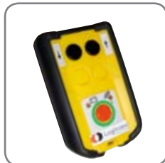
Sender til trådløs fjernbetjening RCW 1, når det ønskes fjernstyring i 2 retninger.