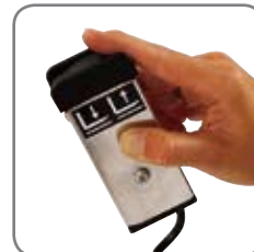
Kabelfjernbetjening RCC, når det ønskes fjernstyring i 2 retninger.