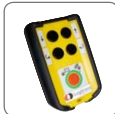
Sender til trådløs fjernbetjening RCW 2, når det ønskes fjernstyring i 4 retninger.