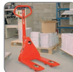
Panther fås med mange forskjellige gaffellengder.

Vi tilbyr også kundetilpassede løsninger.