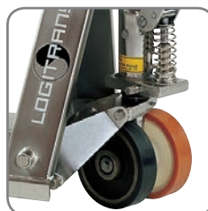
Mulighet for hjulmontering, som passer til brukerens behov.