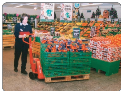
Justerbar gaffelhøyde - ingen problemer med lave og slitte paller.

Jekketrallene fås også i rustfri og eksplosjonssikrede utgaver.