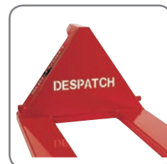
Bedriftens navn/logo kan skjæres ut i jekketrallens trekant.