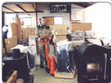
Selv på meget trange plasser sikres det en problemfri håndtering av godset.