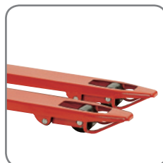
Bøyler under gaffelspissene sikrer, at Panther kjøres lett inn i og ut av paller.