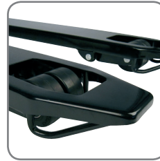
Bøyler under gaffelspissene sikrer, at Panther Silent kjøres lett inn i og ut av paller.