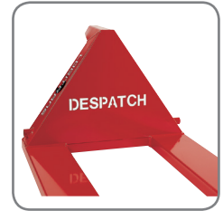
Bedriftens navn/logo kan skjæres ut i jekketrallens trekant på Panther Silent.