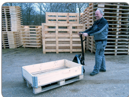
Panther Silent klarer også transport utendørs. Snø, grus og metallspen setter seg ikke fast!