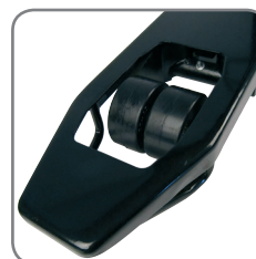
Tvilling gaffelhjul gir minimal svingmotstand.