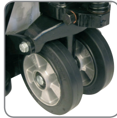
Spesial gummihjul er skånsomme mot gulvbelegg og fliser.