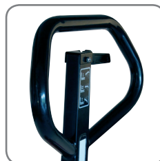
Ergonomisk håndtak gir brukeren et godt og avslappet grep.