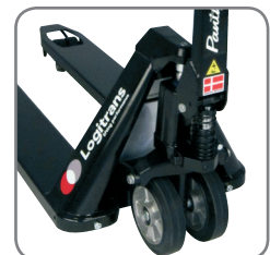
Panther Silent har permanent hurtigløft.

Vi tilbyr også kundetilpassede løsninger.